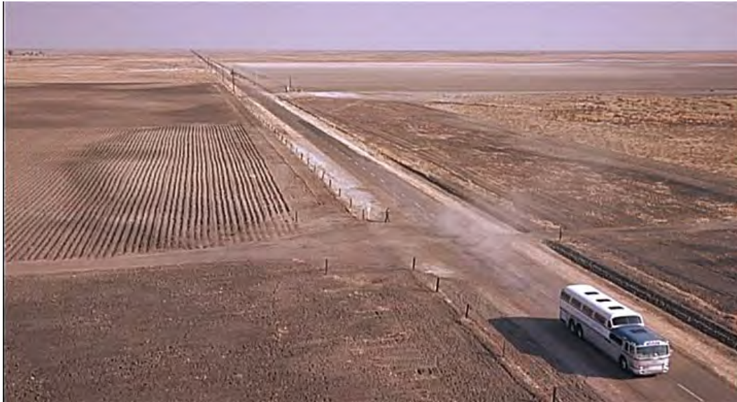
(Slika 1). Hitchcock, Alfred (1959.) Sjever-sjeverozapad , scena iz filma - dolazak autobusom Lokacija: Križanje cesta Corcoran Road i Garces Highway, Wasco, California USA

To pokazuje druga slika iz "američke slikovnice čežnje", a to je fenomenalna scena iz Hitchcockovog filma Sjever-sjeverozapad u kojoj avion napada Cary Granta u potpunoj pustoši tipičnoj za beskrajni američki krajolik. Ako se prisjetimo, scena se odvija na križanju 2 ceste koje se križaju pod pravim kutem. Sva 4 smjera vode na 4 strane svijeta, pravocrtno sve do horizonta. To naravno pojačava napetost filma (suspence) i preko Hitchcocka, i Hollywooda poslana je još jedna slika koja nas očarava, ali tu scenografiju su 200 godina prije Hitchcocka postavili urbanisti, koji se tada nisu tako zvali. Jedan od rezultata takvog urbanizma je mogućnost da se gradovi šire na periferiju kroz unaprijed postavljeni raster. Iz perspektive Zagreba, takvu pravilnost možemo gledati sa oduševljenjem, a odmah nakon toga sa žaljenjem zbog naše nemogućnosti.