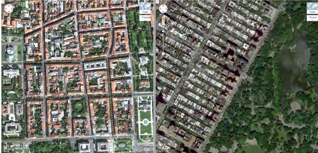
(Slika 3.) Zagreb (2012.) Donji grad i Lenučijeva potkova Izvor: http://maps.google.hr/maps?hl=hr&tab=wl (siječanj 2012.) (Slika 4.) New York (2012.) Manhattan i Central park Izvor: http://maps.google.hr/maps?hl=hr&tab=wl (siječanj 2012.)

Posebno nas može žalostiti što i mi imamo slično nasljeđe u pravilnom rasteru zagrebačkog Donjeg grada, ali on je zaboravljena epizoda iz boljih vremena. Mentalna slika grada Zagreba, ili popularno rečeno slika sa razglednice je Donji Grad, a ne Trešnjevka ili Novi Zagreb.