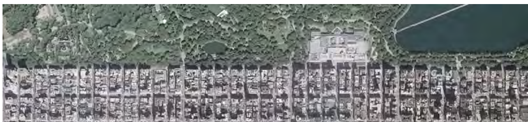
Slika 5. Nelson, Garrett Dash (2009.) Grid and Anti-grid , Izvorna slika na naslovnoj strani

Osvrt na tekst "Grid and Anti-Grid - A landscape dialectic of socioenvironmental ideas" 2 Garrett Dash Nelson 3 , svibanj 2009.