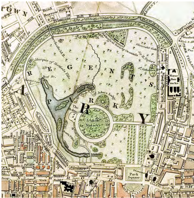
Slika 8. Nash, John (1833.) Regent Park, London

Početak 19. stoljeća ekonomija jača i situacija se mijenja. Umjesto jednostavnog postavljanja ulica u pravilnom rasteru, i prepuštanju nadi da će se stvari same od sebe postaviti na bolje, gradske uprave postaju dovoljno snažne za rekonstrukcije gradova prema novim idealima, 11 odnosno prema već formiranim idejama engleskog pejzažnog vrta, koji sada iz periferije konačno može ući u gradske matrice. Takav je npr. projekt za Regent park 1833.