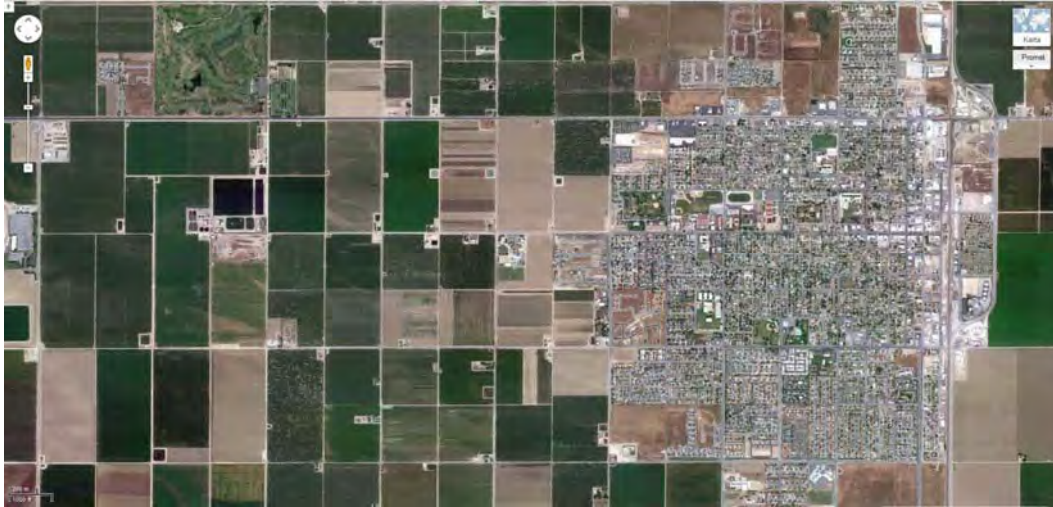
Slika 6. Wasco 2012. Gradić sa 25000 stanovnika prati postojeći raster izvan grada. Lokacija: u blizini raskršća gdje je snimljena scena iz filma Sjever-sjeverozapad. Izvor: http://maps.google.hr/maps?hl=hr&tab=wl (siječanj 2012.)