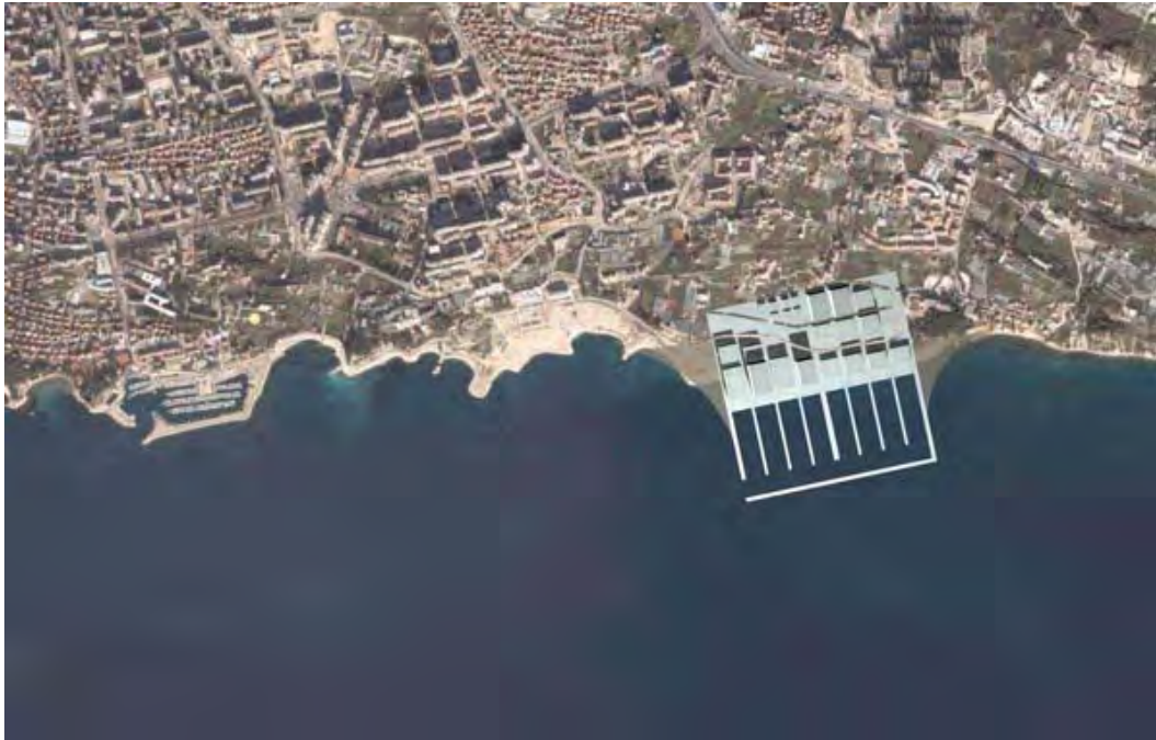
Slika 13 Radman Andrej, Vrbanek Igor (2009.) Natječajni projekt za Duilovo, Split

Na kraju ovog teksta prilažem i jedan mali osobni doprinos rasteru. U natječaju za Duilovo u Splitu smo kolega Andrej Radman i ja predložili novogradnju točno u jedno polje antičkog rastera - centurijacije - koja postoji u Splitu. Ako se pažljivije pogledaju karte i snimke Splita, raster ulica u većem dijelu poštuje raster centurijacije gotovo na jednak način kao što to čine američki gradovi. Ipak daljnjim promatranjem vidi se sustavno krivljenje i lomljenje rastera koje traje već 2000 godina.