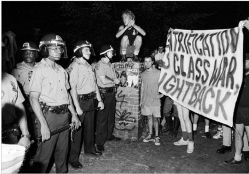
Slika 11. (1988) Tompkins Square Park Riot