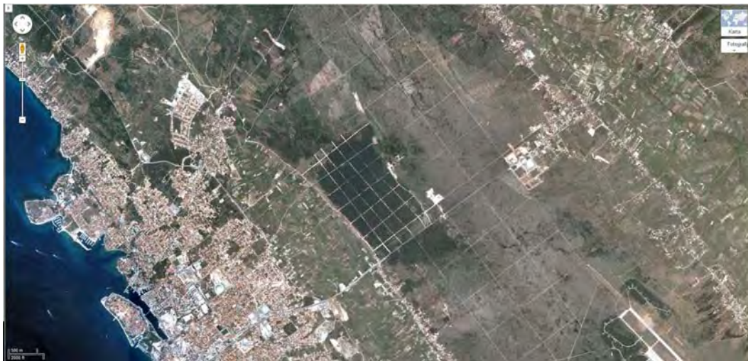
Slika 7. Zadar 2012. Grad sa 76000 stanovnika ne prati postojeći antički raster izvan grada. Izvor: http://maps.google.hr/maps?hl=hr&tab=wl (siječanj 2012.)

Ipak unatoč takvoj fenomenalnoj uspješnosti, u SAD postoje kritike upućene prema rasteru, tom tako jednostavnom i uspješnom načinu planiranja. U tom kontekstu, a posebno iz komplicirane Evrope i još kompliciranijeg Zagreba, takva kritika može biti vrlo zanimljiva. Zbog toga je odabran predmetni tekst.